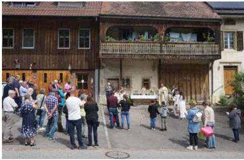
Fronleichnam 2026