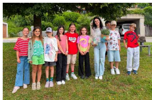
Marion Scalinci