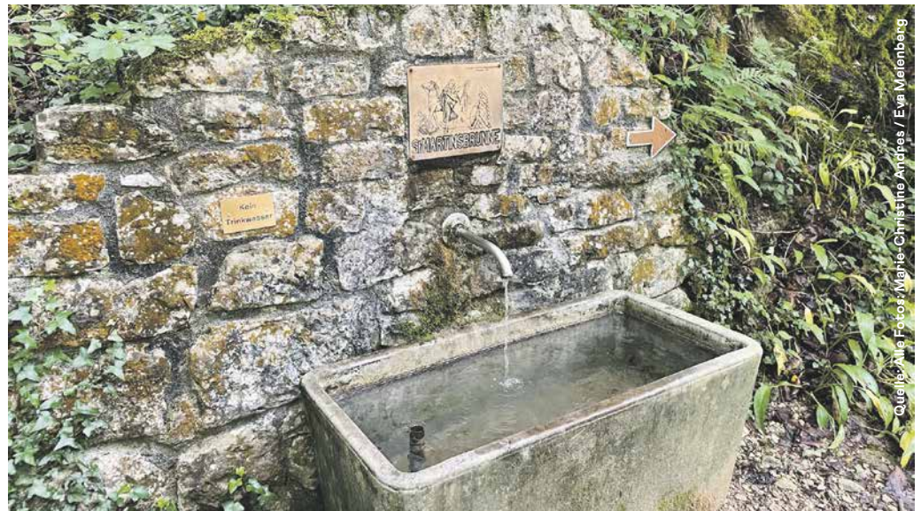
Obwohl das Martinsbrünneli fast ein wenig unscheinbar am Waldweg steht, soll sein Wasser es in sich haben.

Auf den Hügeln rund um Wittnau reifen die Kirschen. Hier ist auch das Holz gewachsen,