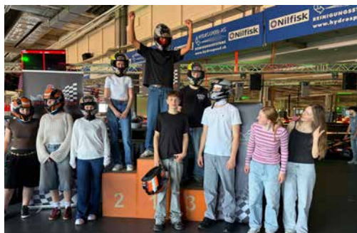
Marion Scalinci